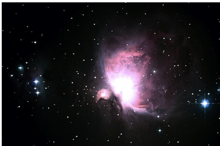
Фотография сделана через телескоп Levehuk Skyline PRO 2000 EQ

$ ТОП-5 красивых космических объектов, которые можно увидеть в домашний телескоп