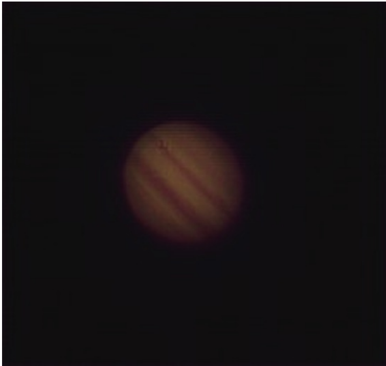
Фотография сделана через телескоп Levehuk Skyline PRO 1000 EQ

Узнали? Да, это Юпитер! И его тоже можно увидеть в телескоп. Как и Венеру, Сатурн, Уран и Нептун, и многие другие космические объекты.