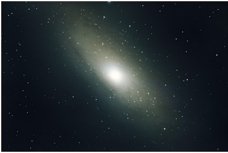
Фотография сделана через телескоп BRESSER Messier NT-203

Галактика (или туманность) Андромеды — одна из самых близких к нам галактик. Близко — понятие относительное: это около 2,52 миллиона световых лет. Из-за удаленности мы видим эту галактику такой, какой она была 2,5 миллиона лет назад. Тогда на Земле еще не было людей. Как Галактика Андромеды выглядит сейчас на самом деле, узнать невозможно.